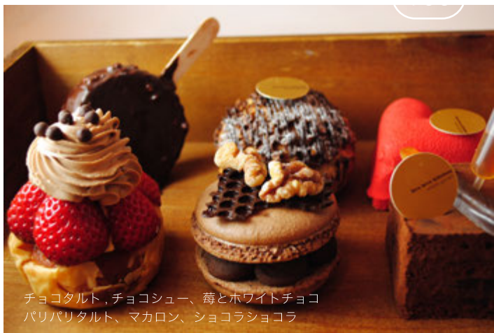
チョコタルト、チョコシュー、苺とホワイトチョコ パリパリタルト、マカロン、ショコラショコラ